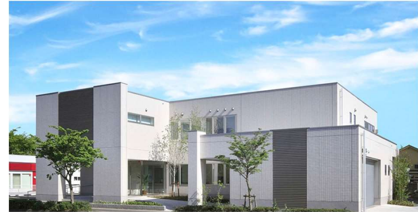
医療・介護・保育等施設